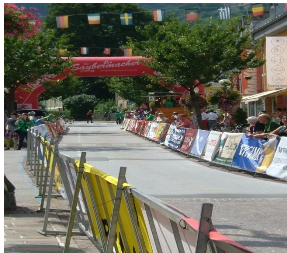
Zielgerade vom Kriterium

jetzt geht es nur noch Runter und bis zur 2 letzten Kurve war ich noch erster aber bin eindeutig zu weit draussen gefahren so dass 6 an mir vorbei gefahren sind. Gut war einer aus der Master 4 so bin ich gerade noch im 6.Rang klassiert. Bin nicht so zufrieden habe heute bessere Platzierung vergeben.